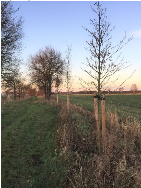
De inplant van nieuwe bomen langs de A27 is nog niet helemaal afgerond.

Om de rups dit jaar op een milieuvriendelijker wijze te bestrijden heeft SBP op advies van de Vogelbescherming Nederland vogelnesten (voor mezen) aangeschaft. Begin maart zullen deze nestkasten door onze vrijwilligers en met medewerking van de Stichting CO worden opgehangen.